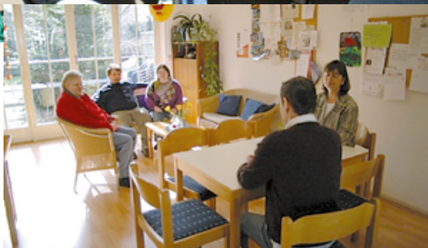
Kontakt- und Beratungsstelle der Psychiatrischen Hilfgemeinschaft Viersen