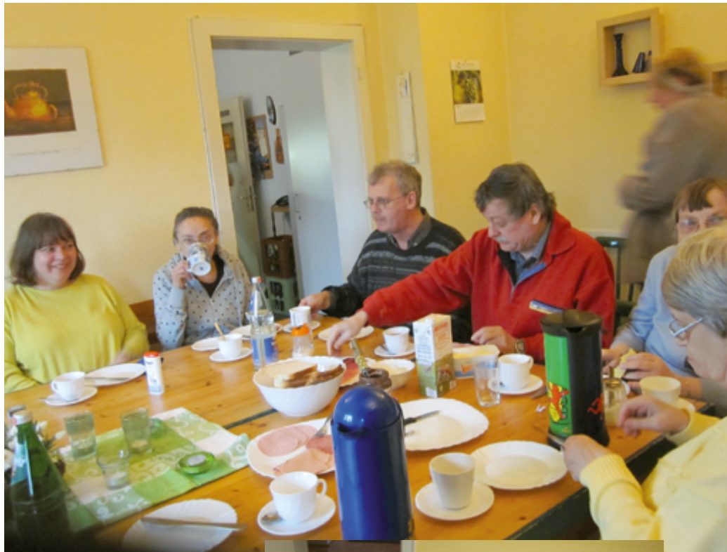
Gemeinsamkeit fängt beim Frühstück an.