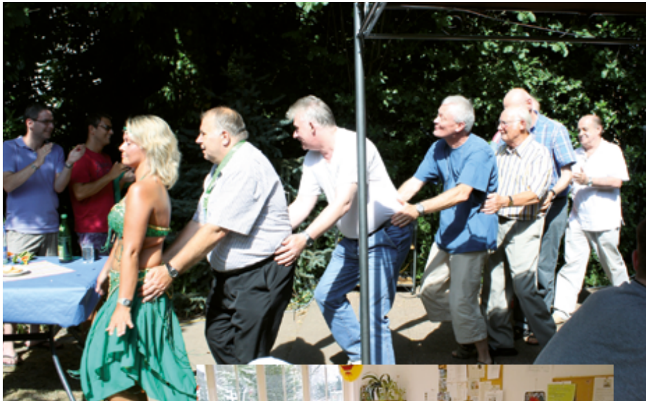
Sommerfest bei der Psychiatrischen Hilfgemeinschaft Viersen

und Verlorengangenes wieder neu zu entdecken und auszuprobieren. Entsprechend den Interessen der Besucher werden in der Kontaktstelle Gruppenaktivitäten entwickelt und angeboten. www.phg-viersen.de